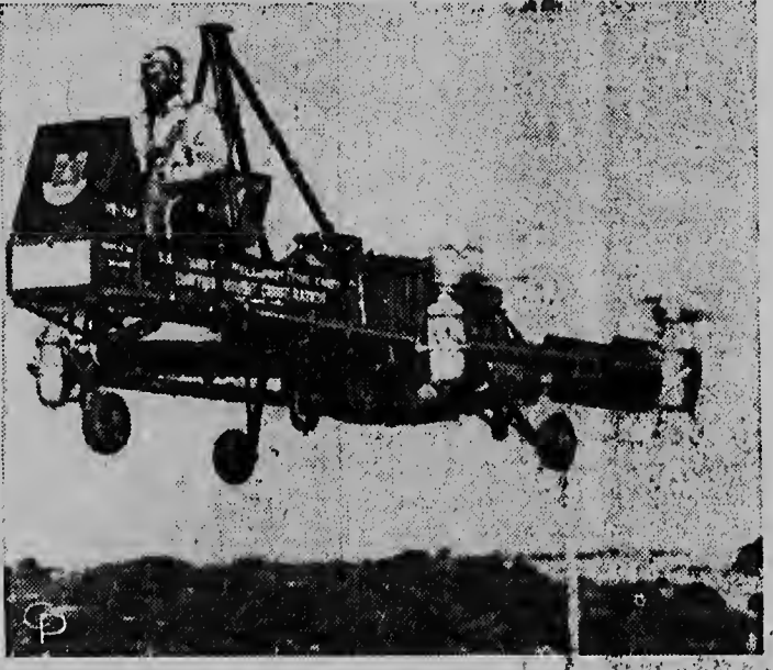
ESQUI TA "THE FLYING CARCASS".

E ta un plataforma aerea construi pa Curtiss-Wright cu ta ser usa pa U.S. Army i ta haciendo awor manuvranan te na Fort Ord, banda di Monterey, Calif. Oficialmente e ta VZ-7AP e ta aterriza verticalmente i ta haci tur sorto di trabao. E destina pa bula abao pa persigui enemigunan hizando cosnan pisa foi suela. E ta un dje inventonan masha moderno i util alavez.